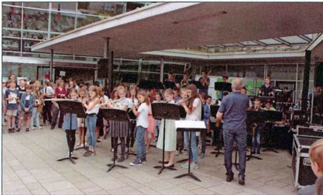
Die Bläserklasse des PJG unterhielt die Gäste mit mitreißenden Klängen.

Musik, Kulinarik und zahlreiche Mitmach-Angebote begeisterten die Besucher